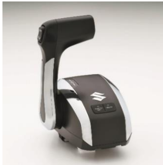
Einzel Top Mount Controller