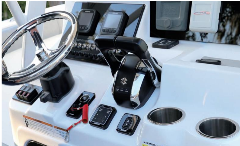
Neues Layout des Zubehörs auf der Konsole

Die Suzuki Motor Corporation kündigte auf dem Cannes Yachting Festival 2021 die Einführung der neuen Suzuki Precision Control an, ein überarbeitetes elektronisches Gas- und Schaltsystem, sowie das neue Keyless Start System, das die Motoren mit einem Knopfdruck startet. Suzuki kündigte außerdem ein Software-Update des Suzuki-Farb-LCD-Multifunktionsmessgeräts an. Das Festival findet vom 7. bis 12. September 2021 in Cannes im Südosten Frankreichs statt.