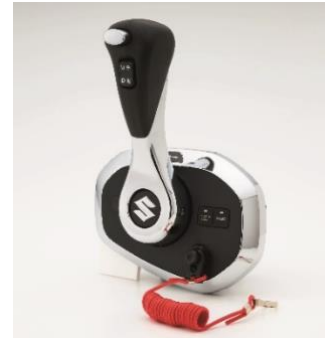
Flush Mount Controller