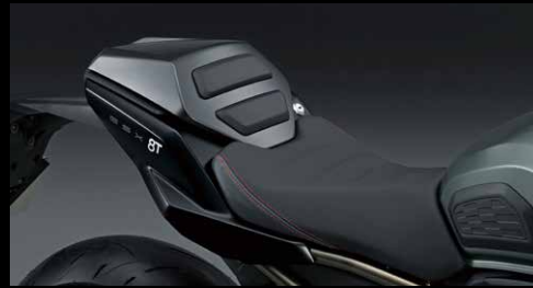
Soziusabdeckung 8T/8TT 45041-47L00-YKV

Getöntes Windschild, das für einen coolen, sportlichen Look sorgt. Exklusiv nur für die GSX-8T.