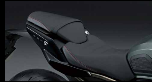
Sitzbank Set 8T 45021-47L00-C5F

Verleihe deinem Motorrad einen sportlichen Look mit dieser hochwertigen Soziusabdeckung.