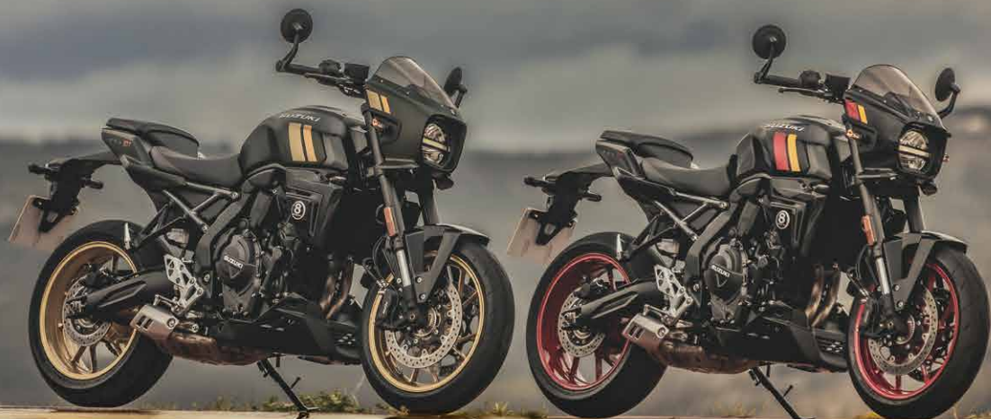
Pearl Mat Shadow Green (QU5)