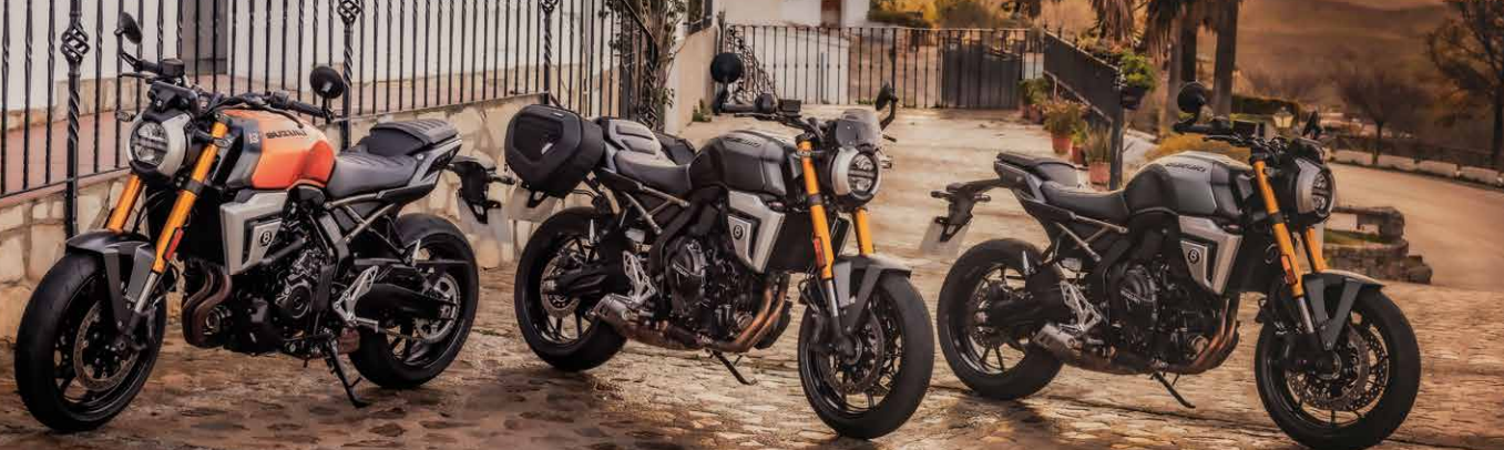
Candy Burnt Gold (QSY)