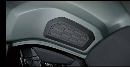
Seitlicher Tankschutz 8T/8TT 44041-47L00-000

Verleihe deinem Motorrad einen neuen Look mit diesem hochwertigen Sitzbank Set! Exklusiv nur für die GSX-8T.