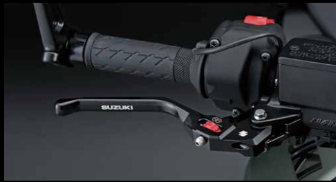
Aluminium Bremshebel 8T/8TT 57400-25830-000

Seitliche Tankpads im Vintage Style zum Schutz vor Kratzern. Set für rechte und linke Seite.