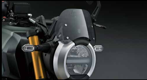
Windschild 8T 51015-47L00-000

Eine exklusive Kollektion sorgfältig entwickelter Zubehörteile – perfekt abgestimmt auf Qualität, Funktion und Design. Wähle aus einer Vielzahl an Optionen für mehr Komfort, praktische Alltagstauglichkeit und zusätzlichen Schutz. So gestaltest du deine GSX-8T/8TT individuell und bringst deinen persönlichen Stil auf die Straße.