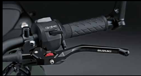
Aluminium Kupplungshebel 8T/8TT 57620-25830-000

Es werden zwei verschiedene Farben (blau und rot) für den Hebelversteller mitgeliefert.