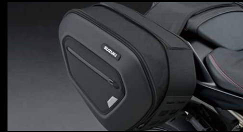
Softtaschen 8T/8TT 95061-47L00-000

Es werden zwei verschiedene Farben (blau und rot) für den Hebelversteller mitgeliefert.